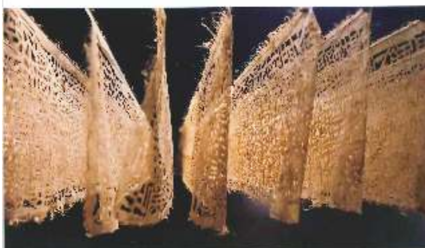
宁波东叶工艺品有限公司首届蔺草纤维纸艺术展开幕式