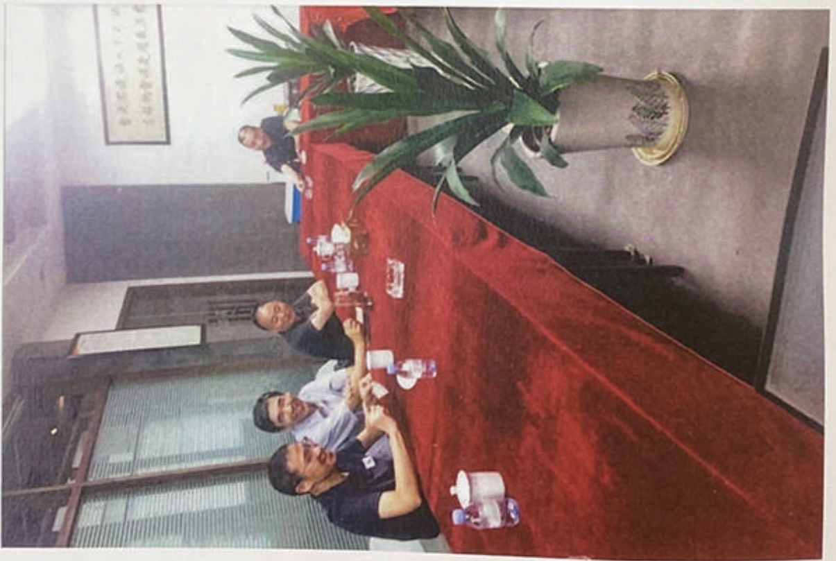
2020年7月31日下午宁波市农业农村局副局长林宇皓一行参观茜草博物馆